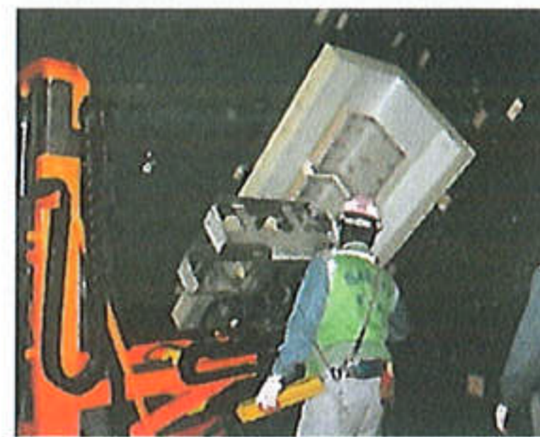
특수단열 패널 설치